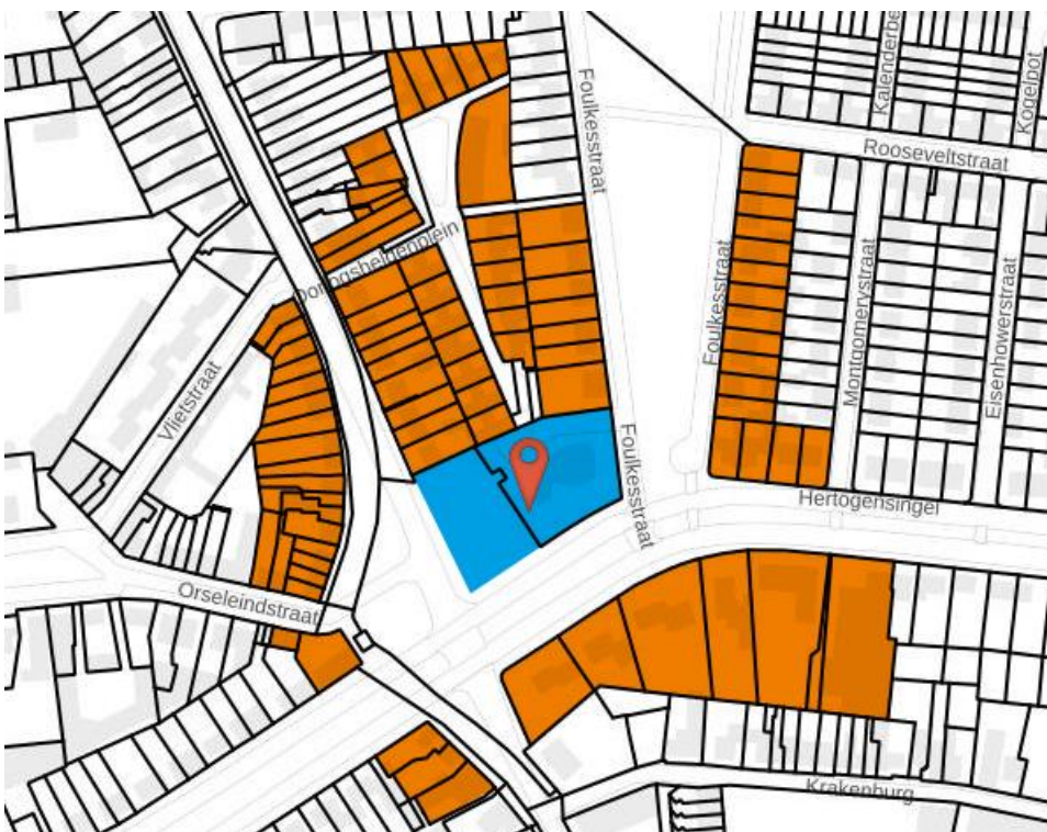
Figuur 1 verspreidingsgebied

Naast de inschrijvers op de website is ook in afstemming met gemeente Oss gekeken naar welk gebied rondom de ontwikkellocatie een direct schrijven wordt verstuurd met een update over de ontwikkelingen op de locatie. Dit gebied is weergegeven op onderstaande Figuur 1. De bewoners van deze adressen en de inschrijvers op de website hebben onder andere berichten ontvangen over de ontwikkeling van 24 zorgappartementen en de koopappartementen voor o.a. senioren en medioren het inschrijven op onze website, over de vaststelling van een ambtiedocument en over de uitnodiging voor een inloopavond.