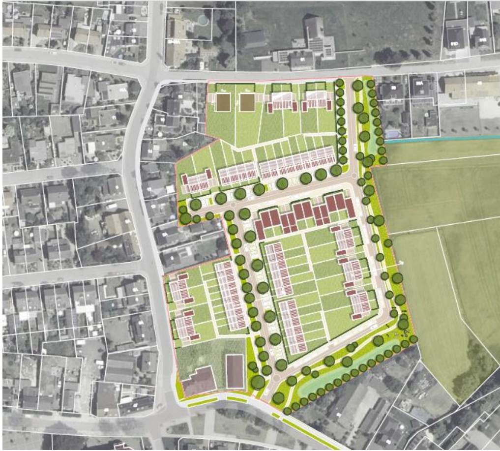
Overzichtskaartje van plangebied